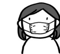
縮んで小さすぎる