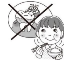
むし歯や歯周病を防ぐ