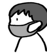
ゴムが伸びて鼻がでている

鼻と口を覆うものを着用し、また布製マスクは1日1回の洗濯により約1ヶ月の利用が可能と言われています。